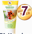
7 GTA Handcreme 75 ml