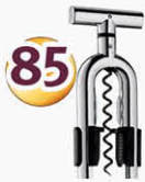
WMF Korkenzieher für Prosecco und Wein