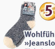
Wohlfühlsocken »Jeanslook« Einheitsgröße