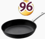
WMF Edelstahlpfanne beschichtet Ø 24 cm