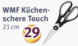
WMF Küchenschere Touch 21 cm

Sammeln Sie Hubertus-Taler bei jedem Einkauf*