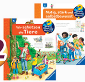
Ravensburger Bücher Wieso? Weshalb? Warum? 4 bis 7 Jahre