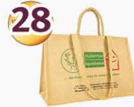
Jute – Tasche groß 50 x 35 x 24 cm