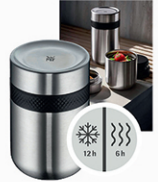
WMF Thermo Speisebehälter Set 2-tlg. / 300ml + 200ml