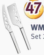
WMF Käsemesser Set 2-tlg.