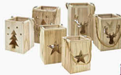
Holzlaterne 2er Set groß 15x24x15 cm | klein 13x19x13 cm

Sammeln Sie Hubertus-Taler bei jedem Einkauf*